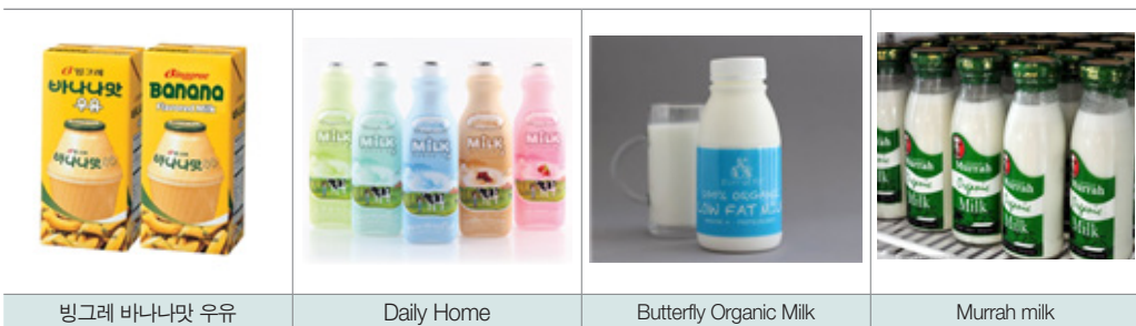
| 할랄인증 획득 김치 |